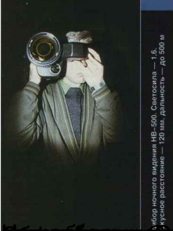
...многого измерения NB-500. Светосила — 1,6. ...кусная расстояние — 120 мм, дальность — до 500 м