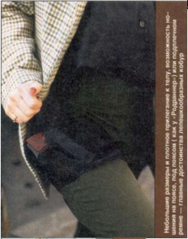
Наибольшее количество людей предпочитают носить на поясе, под пиджаком или под рубашкой. Самые популярные модели — это «Батман», «Коваль», «Джентльмен», «Дядя Илья».